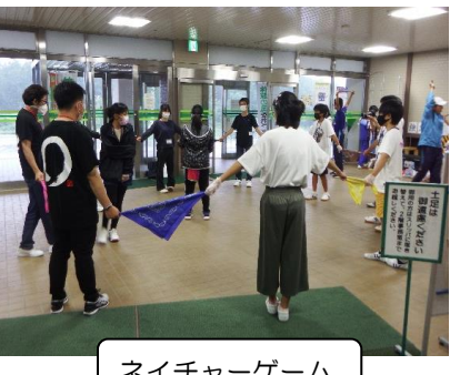
ネイチャーゲーム