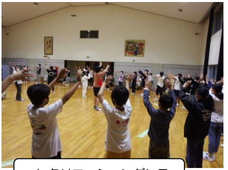
レクリエーションダンス

2日目の夜は、岐阜県シニアリーダーの方々によるお楽しみの企画です。 班対抗のゲーム、レクリエーションダンスなどが、すべて物語仕立てに なって演出されていきます。シニアリーダーのみなさんの熱演、巧みな話 術に引き込まれていきます。 次々と進行する内容は、実に新鮮で、心が解放されていき、会場が一体 となって楽しい時間を共有しました。