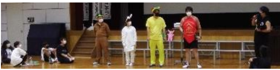
シニアリーダーによる「金太郎・きつね・うさぎ・さる」が登場