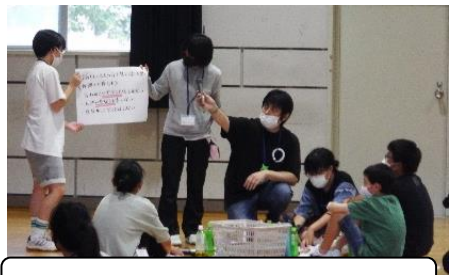
班交流……テーマごとの約束づくり