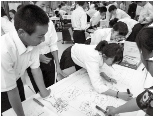
▲ ワークショップの様子

○先生のおもしろい話が聞ける授業や、理解しやすくなるような工夫が取り入れられた授業がよい。