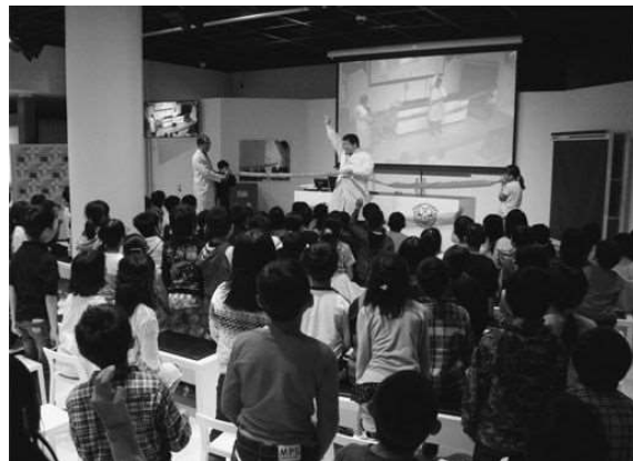
△サイエンスショー