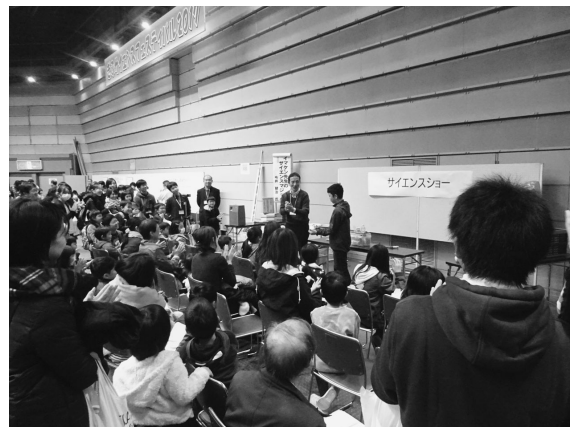
△サイエンスフェスティバル講演会