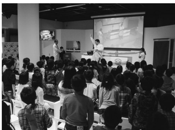
△サイエンスショー