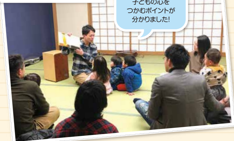
子どもの心をつかむポイントが分かりました!

また今回の読み聞かせには、これまでパパ大学を受講したパパもボランティアで読み手に挑戦! 普段から子どもに読み聞かせをしているとあって、臨場感のある読み方に子どもたちも釘付けで