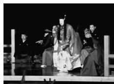
▲長良川新能 (令和7年度の様子)

●ぎふサイエンスフェスティバル2026 11月21日(土)～23日(月・祝)／科学館