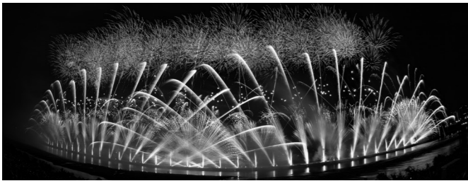
▲ぎふ長良川花火大会

●夏の特別展 7月18日(土)～8月30日(日)／科学館 ●ぎふ長良川花火大会 8月8日(土)／長良川河畔