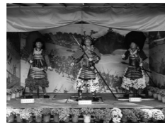
▲岐阜公園 菊人形・菊花展

●岐阜公園菊人形・菊花展 10月31日(土)～11月23日(月・祝) ／岐阜公園