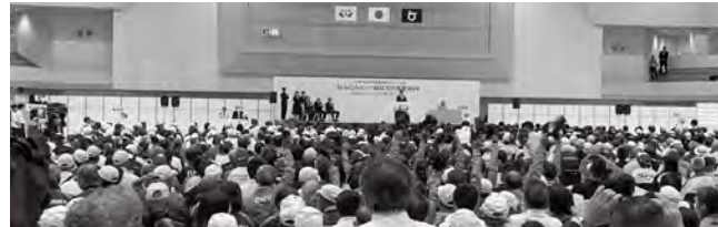
▲ねんりんピックはばたけ鳥取2024総合開会式

ふれあい広場やふれあいニュースポーツ、健康フェアなど誰でも参加できるさまざまなイベントが開催されます。