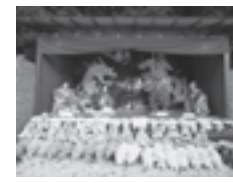
▲岐阜公園菊人形・菊花展