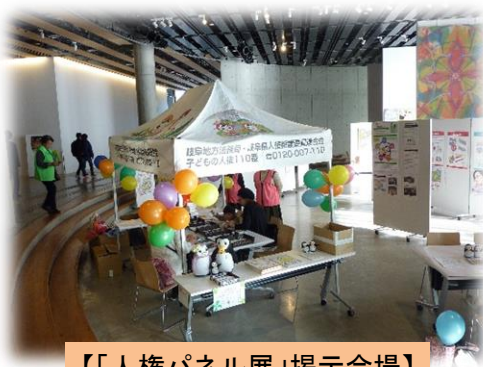
【「人権パネル展」掲示会場】

人権擁護委員、更生保護関係団体（保護司会・更生保護女性会・BBS会）、障害者生活支援センターなどの人権関係団体の協力を得て、人権啓発の展示やイベントを行いました。