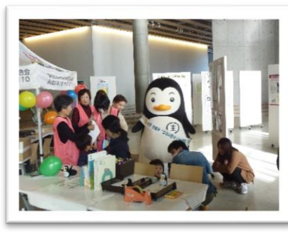
【更生保護活動のマスコットキャラクター“ホコちゃん”と撮影を楽しむ市民】