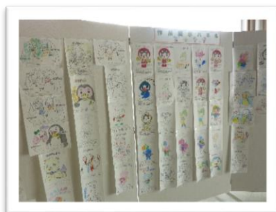
【子どもたちの力作“ぬり絵”】