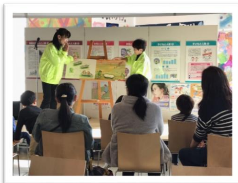
【人権擁護委員による読み聞かせ】