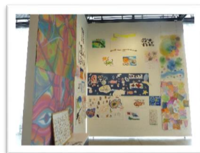
【壁一面を飾るアート作品】