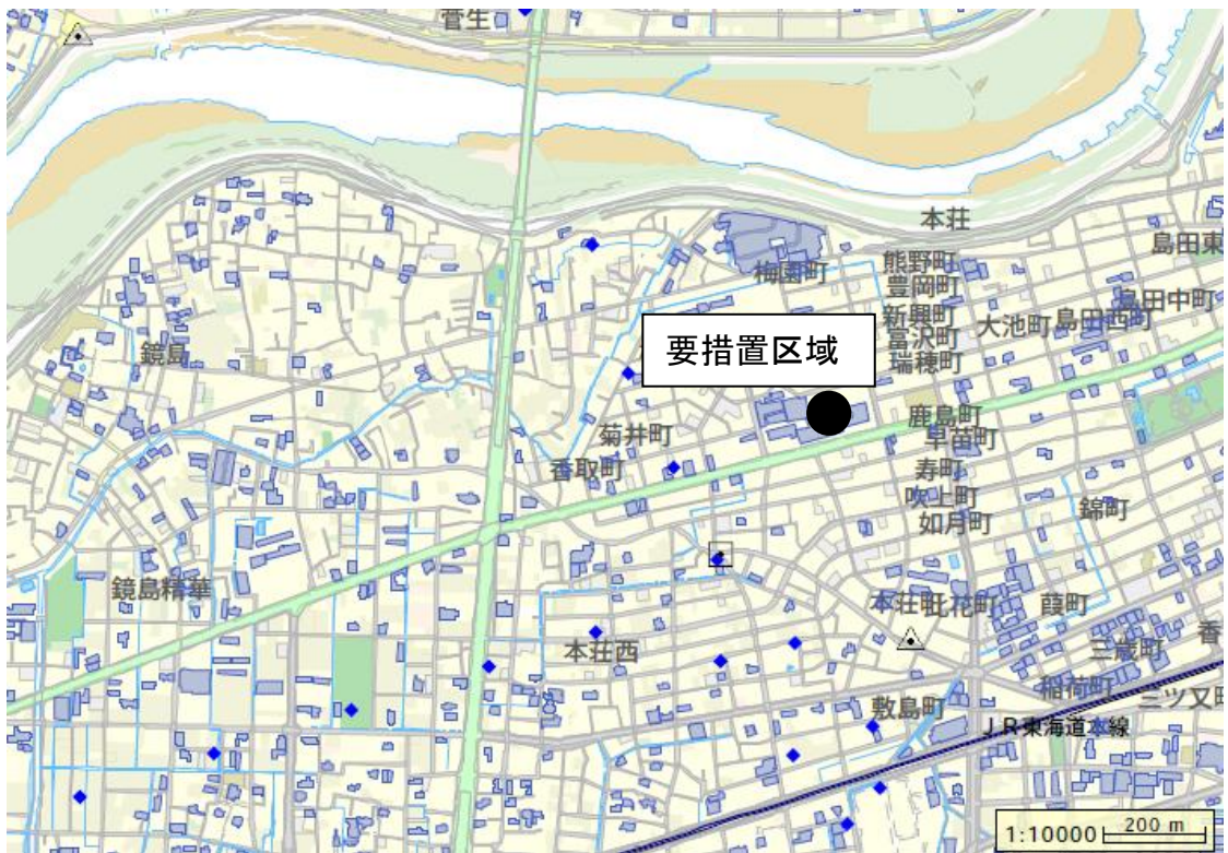
図1 要措置区域の位置