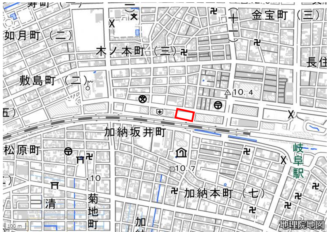
図1 要措置区域の位置図