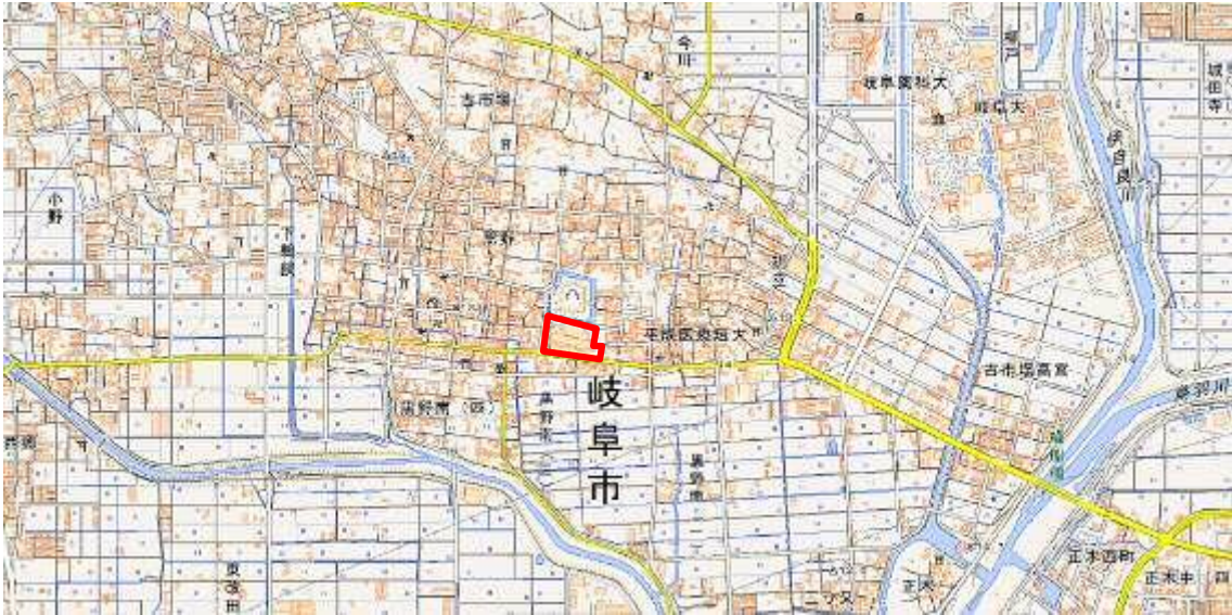
図1 要措置区域の位置図