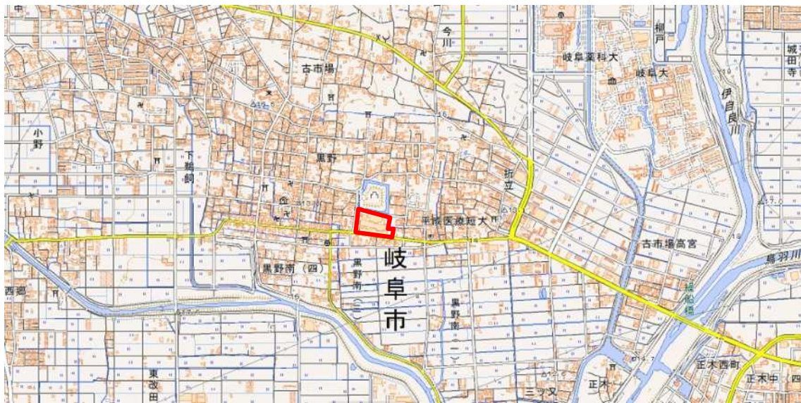
図1 要措置区域の位置図