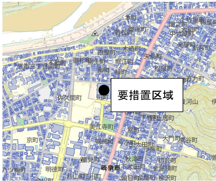
図1 要措置区域の位置