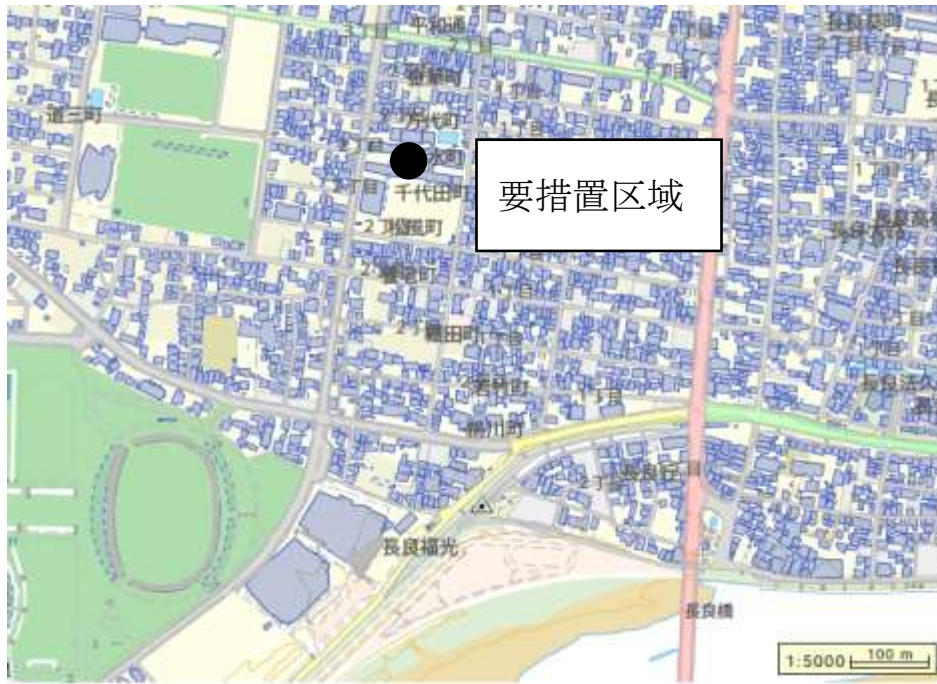
図1 要措置区域の位置