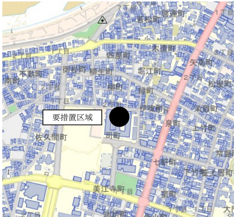
図1 要措置区域の位置