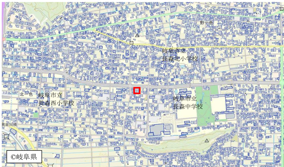
図1 要措置区域の位置図