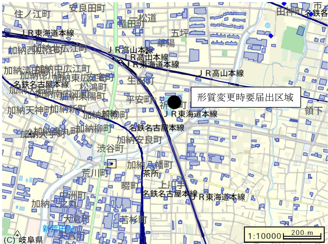
図1 形質変更時要届出区域の位置