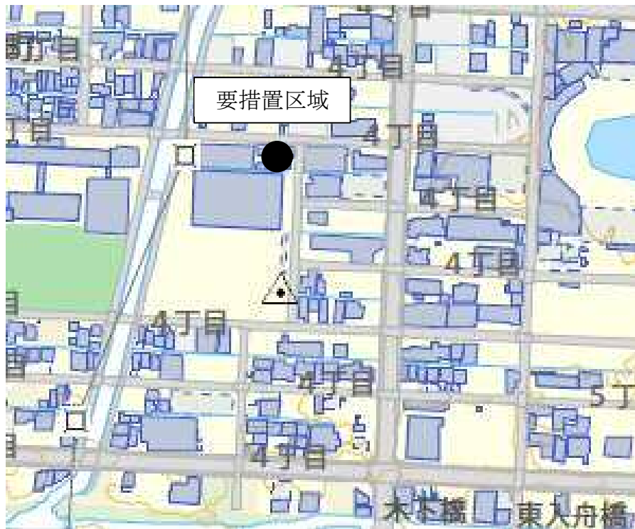
図1 要措置区域の位置