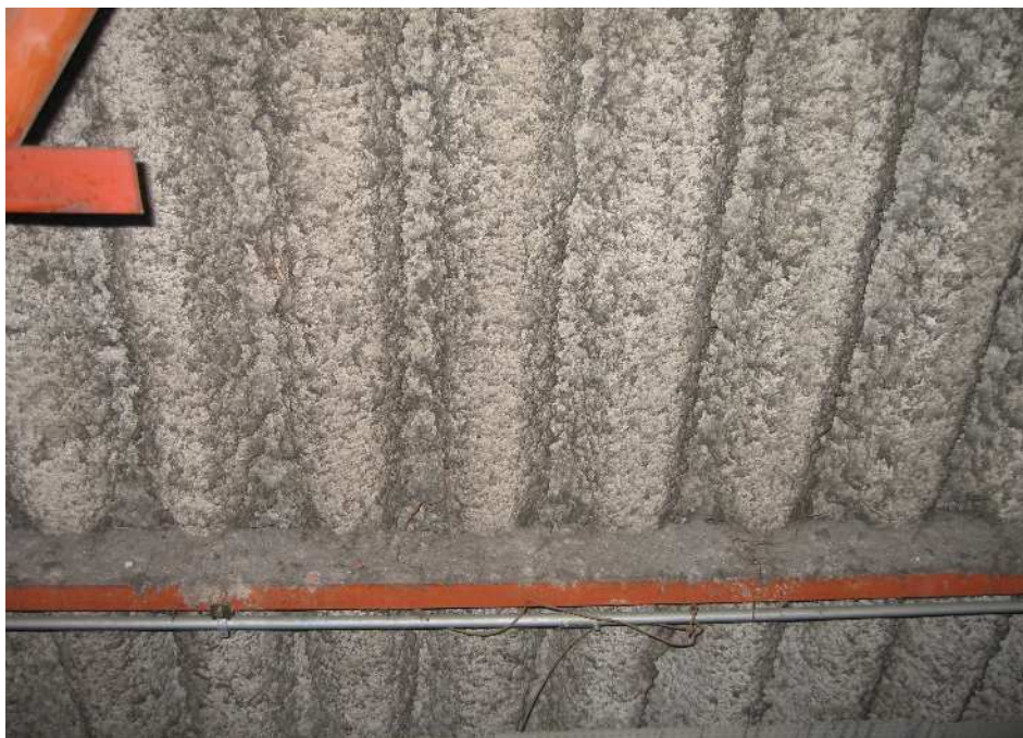
天井断熱材として吹き付けられた例