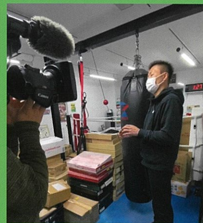
中京テレビ!キャッチ・ストライクで 放送されました

賞味期限が明記されていない 開封済み 医療用医薬品 生鮮食品 冷蔵冷凍食品 アルコール (みりん・料理酒は除く)