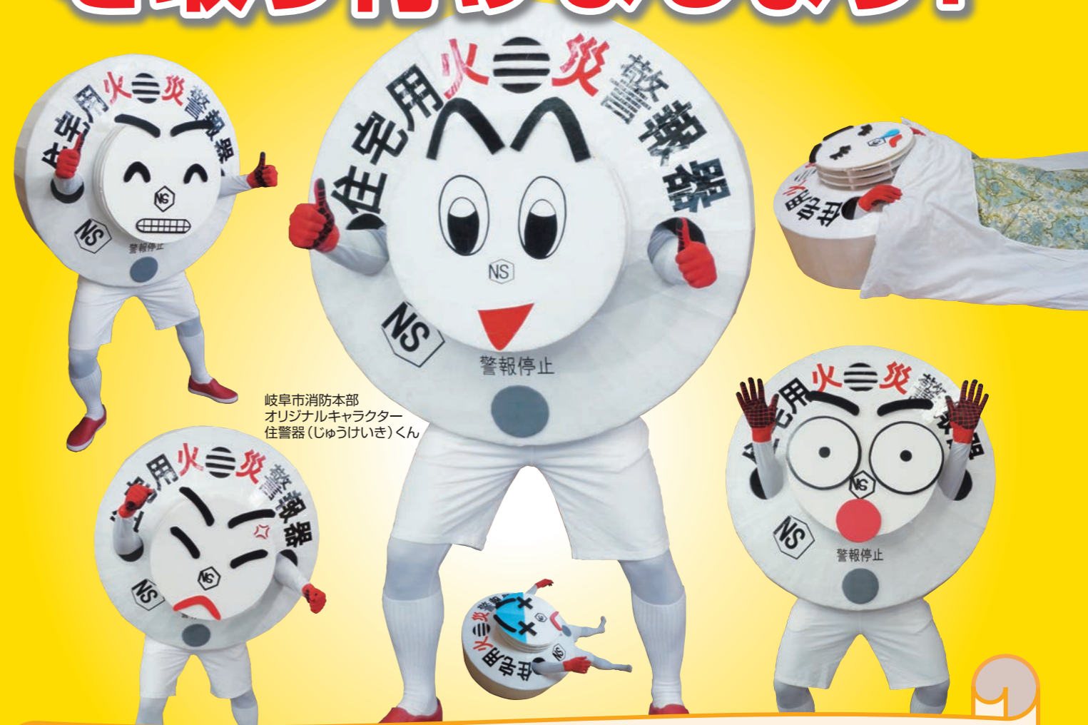
岐阜市消防本部 オリジナルキャラクター 住警器(じゅうけいき)くん