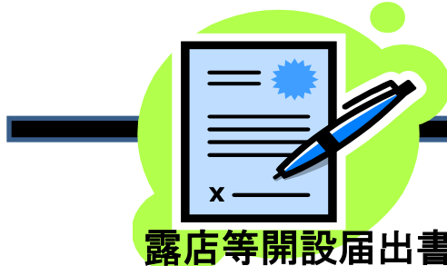
露店等開設届出書