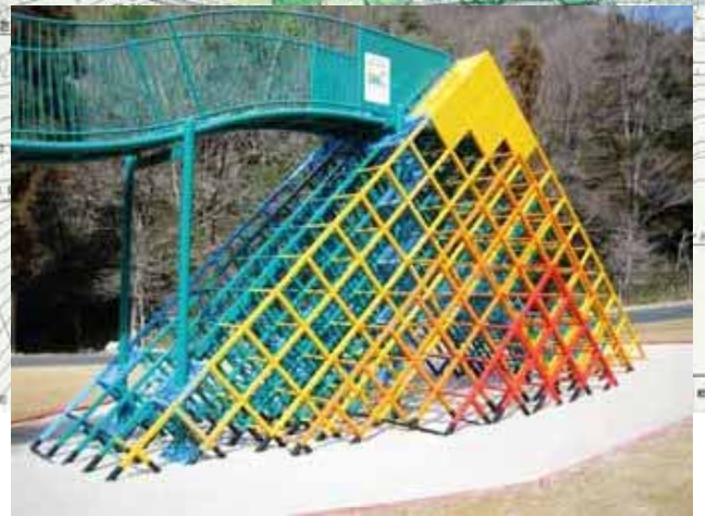
レインボーピラミッド(長さ9.2m、幅4.0m、高さ4.5m)