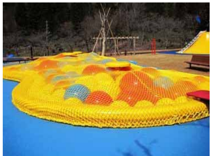
ジャンピングボム (長さ 15.0m、幅 6.0m、高さ 1.0m)