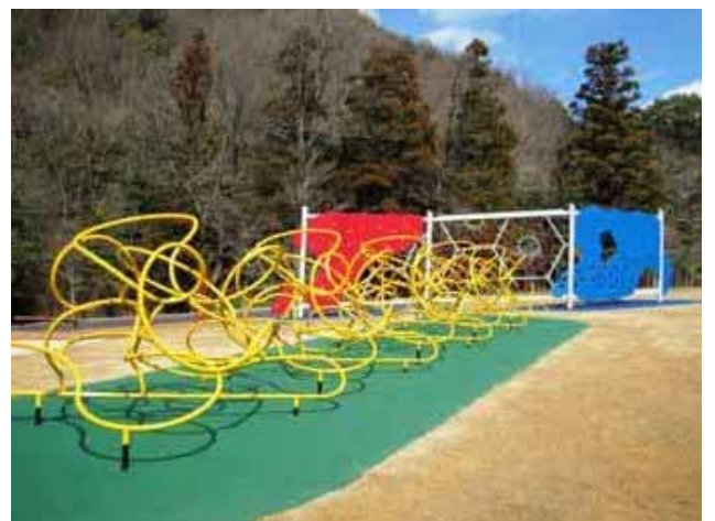
スネイクロード(長さ12.5m、幅2.0m、高さ1.5m) とモンスターウォール(長さ13.5m、高さ3.0m)