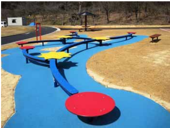
バランスファイト (16.5m×8.8m、舗装含む)