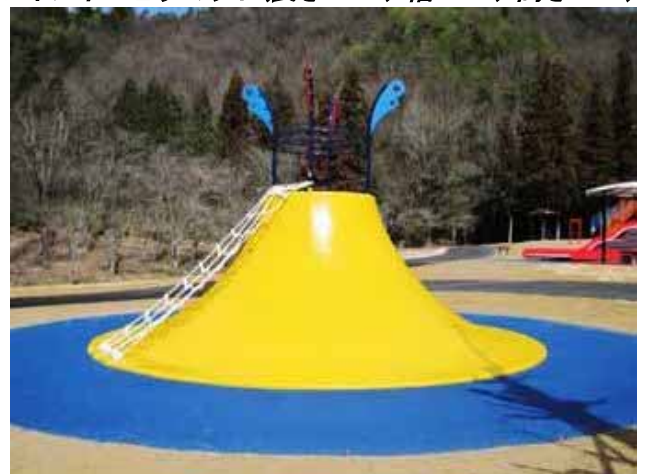
ボルケーノスライド(高さ2.0m、直径6.0m)