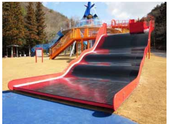
グレートフォール (長さ9.1m、幅4.0m、高さ3.0m)