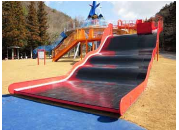
グレートフォール (長さ9.1m、幅4.0m、高さ3.0m)