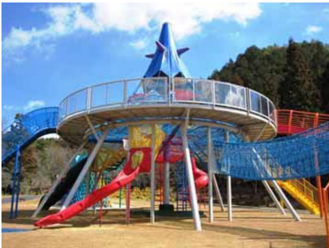
ホーンテッドマウンテン (高さ11.7m、直径12.0m)

「ミワクル広場」は、魅惑的でミラクルな遊具、三輪に来る、みんな来るを意味し、愛称応募総数612点の中から選ばれた作品です。