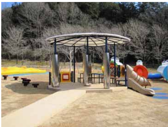
ハッピークラウド (高さ 3.0m、直径 4.8m)