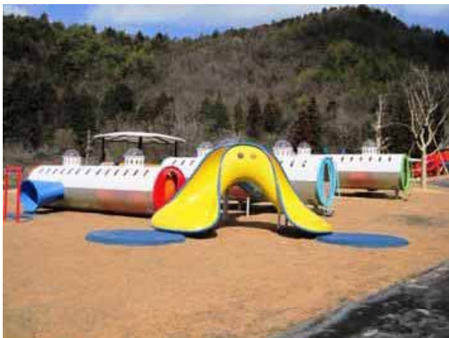
スカラベトンネル (1基の大きさ:長さ6.0m、直径1.5m)