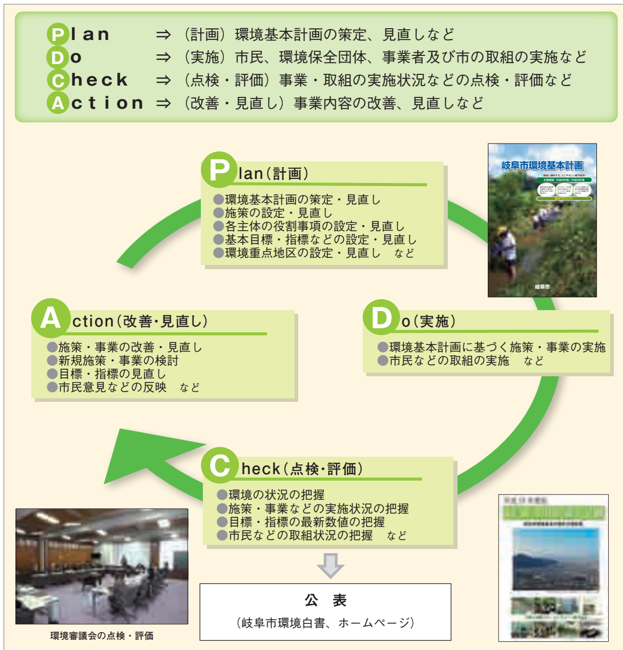
環境基本計画におけるPDCAサイクル