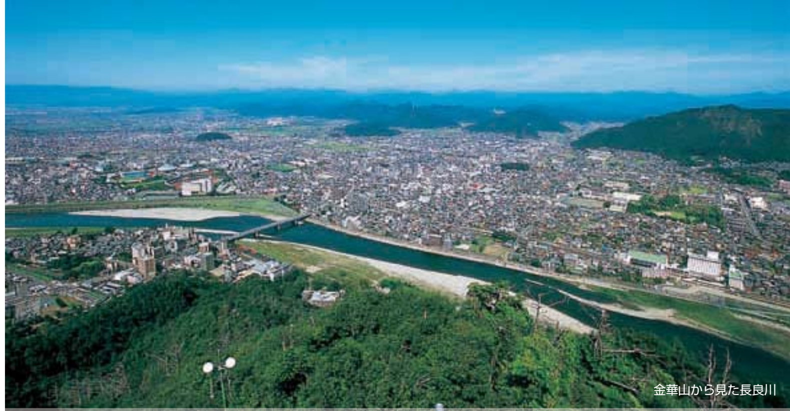
金華山から見た長良川