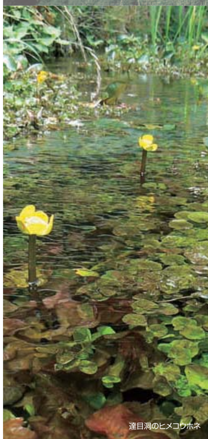
達目洞のヒメコウホネ