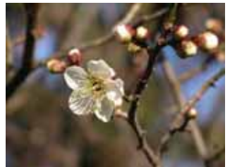
中咲種・小梅 実梅