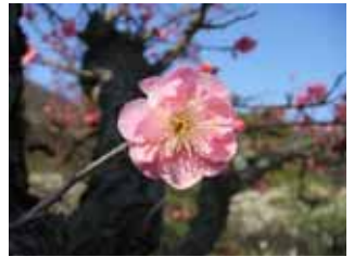
遅咲種・御所紅 野梅系・難波性