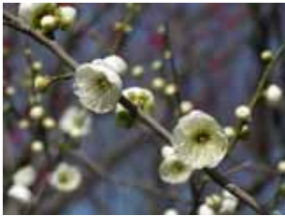
中咲種・玉牡丹 野梅系・野梅性