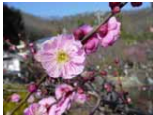
中咲種・難波紅 野梅系・難波性