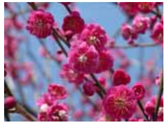
中咲種・蘇芳梅 緋梅系・緋梅性