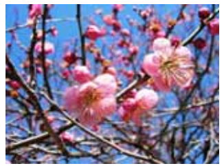
早咲種・烈公梅 野梅系・野梅性