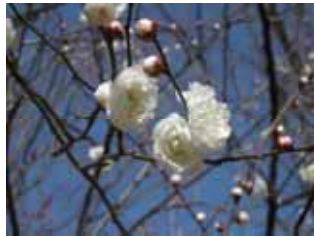
遅咲種・乙女の袖 豊後系・豊後性