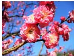
遅咲種・蝶の羽重 豊後系・豊後性