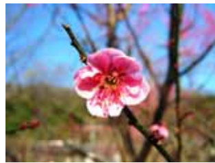
中咲種・幾夜寢覚 緋梅系・紅梅性