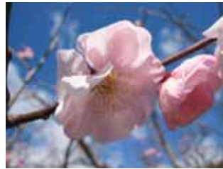
遅咲種・桜鏡 緋梅系・紅梅性