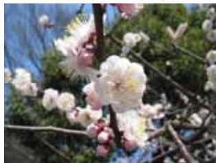
遅咲種・八重揚羽 豊後系・豊後性