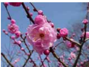
遅咲種・黒田 豊後系・豊後性