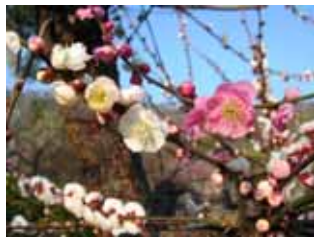
中咲種・輪違い 野梅系・野梅性