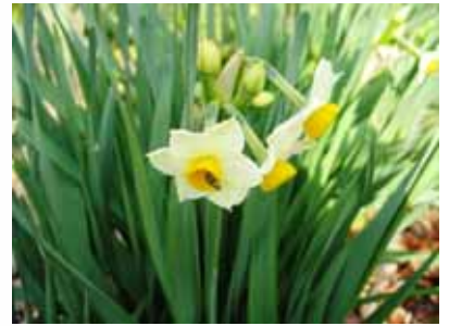
ニホンズイセン (ヒガンバナ科スイセン属)