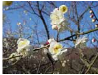
早咲種・早咲鶯宿 野梅系・野梅性