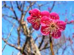
中咲種・大盃 緋梅系・紅梅性