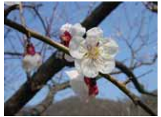
中咲種・御幸 豊後系・豊後性