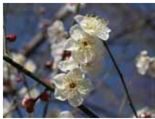
早咲種・冬至梅 野梅系・野梅性