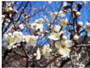
中咲種・茶青梅 野梅系・野梅性