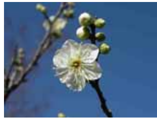
中咲種・青軸 野梅系・青軸性