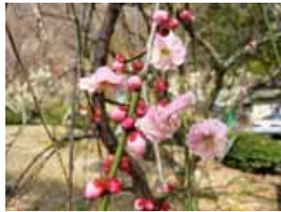
中咲種・玉垣枝垂 枝垂性