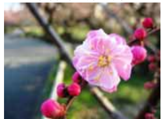
遅咲種・楊貴妃 豊後系・豊後性