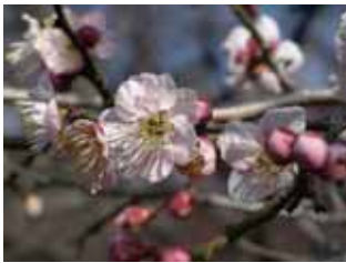
早咲種・紅冬至 野梅系・野梅性