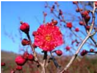
中咲種・鹿兒島紅 緋梅系・緋梅性