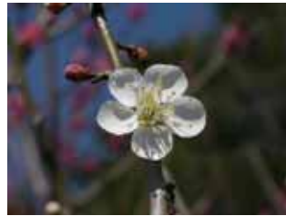
中咲種・白加賀 実梅