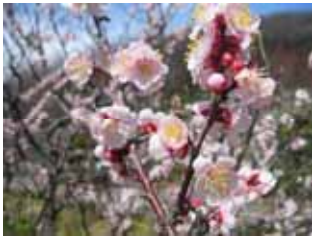
遅咲種・豊後鶯宿 実梅