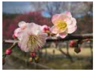
中咲種・内裏 野梅系・紅筆性