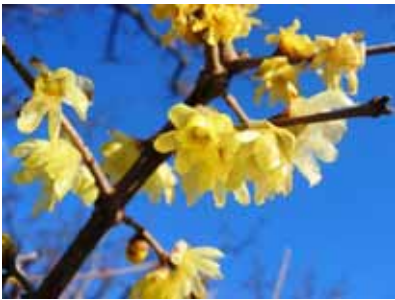
素心蠟梅 (ロウバイ科ロウバイ属)