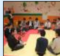
育児サークルわんぱくキッズ ～お父さんの子育て講座～