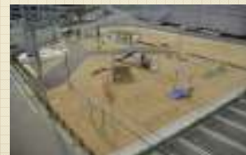
正木古川公園(正木2号)