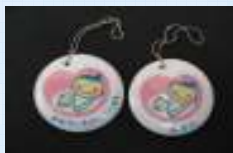
マタニティマーク