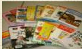
市立図書館の図書