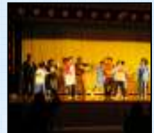
(障がい者の) 演劇を楽しむ会