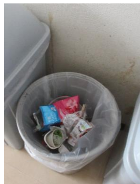
燃えるゴミ（普通ごみ） 紙類の混入なし。