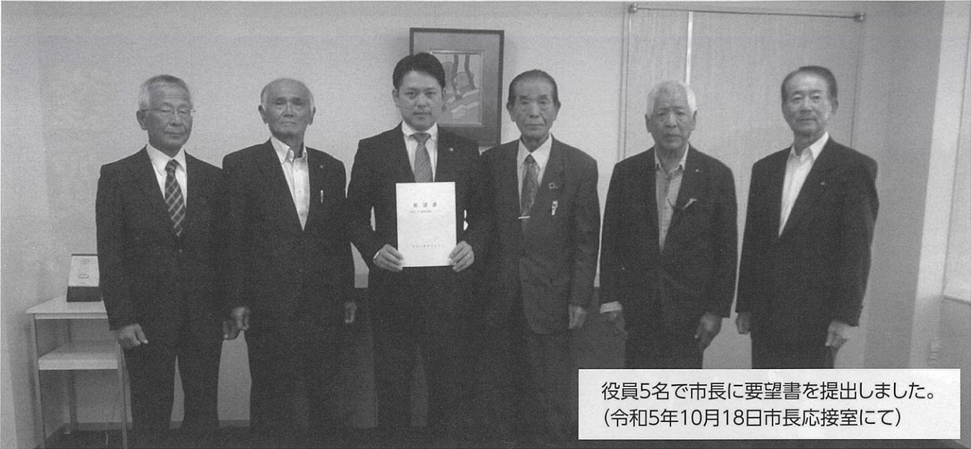
役員5名で市長に要望書を提出しました。 (令和5年10月18日市長応接室にて)