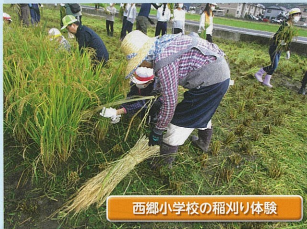
西郷小学校の稲刈り体験