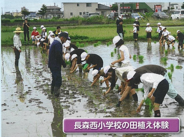
長森西小学校の田植え体験

岐阜市食農教育児童実践支援事業実行委員会では、農作業を通じて子どもたちが食と農の密接な関わりと農業の重要性を学び、生きることの最も基本的な要素である「食」とそれを支える「農」について理解を深めることを目的とし、事業を実施しています。