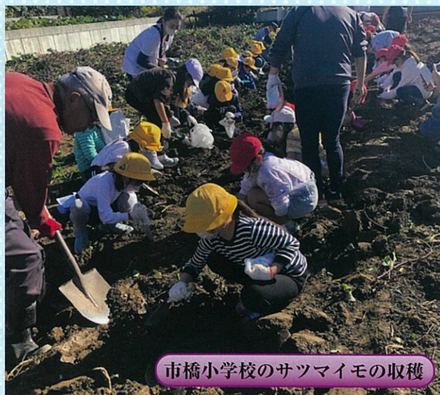
市橋小学校のサツマイモの収穫

令和5年1月1日発行 第112号 ◆編集発行／岐阜市農業委員会 〒500-8701 岐阜市司町40番地1 ☎058(214)2073・2074