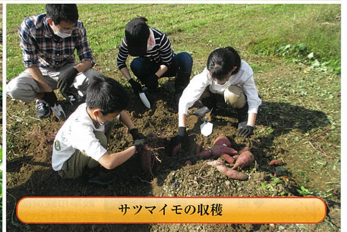
サツマイモの収穫