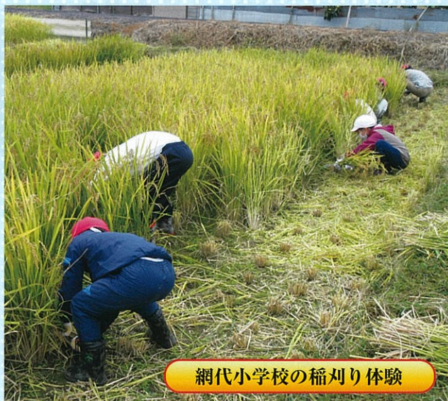
網代小学校の稲刈り体験

岐阜市食農教育児童実践支援事業実行委員会では、農作業を通じて子どもたちが食と農の密接な関わりと農業の重要性を学び、生きることの最も基本的な要素である「食」とそれを支える「農」について理解を深めることを目的とし、事業を実施しています。