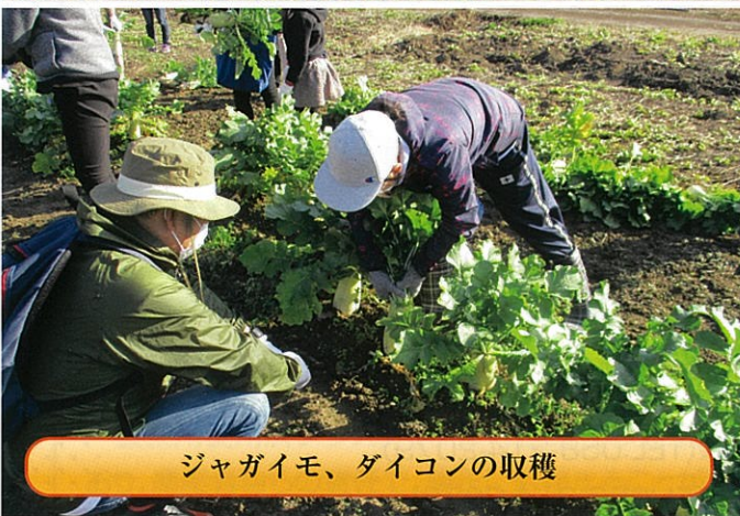
ジャガイモ、ダイコンの収穫