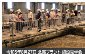
令和5年8月27日 北部プラント 施設見学会