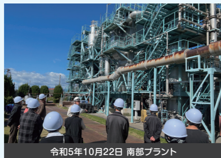
令和5年10月22日 南部プラント