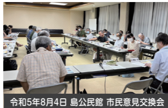
令和5年8月4日 島公民館 市民意見交換会

令和5年7月から10月にかけて、「岐阜市未来のまちづくり構想」に基づく「岐阜市の上下水道事業の現状と取組み」について、広く市民の皆様へ周知し、理解を深めていただくため、自治会連合会単位で市民意見交換会を開催しました。職員が公民館やコミュニティセンターへ出向き、本紙2～3ページの特集「岐阜市の上下水道事業の現状と取組み」と同じ内容の資料をもとに説明を行い、計1,046名の方にご参加いただきました。あわせて、質疑応答やアンケート調査も実施し、多くのご意見をいただきました。なお、市民意見交換会でいただいた質疑やご意見については、ホームページにてご覧いただけます。