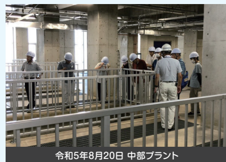
令和5年8月20日 中部プラント

第1回 中部プラント 8月20日(日曜日)10時～12時 参加者18名 第2回 南部プラント 10月22日(日曜日)10時～12時 参加者20名