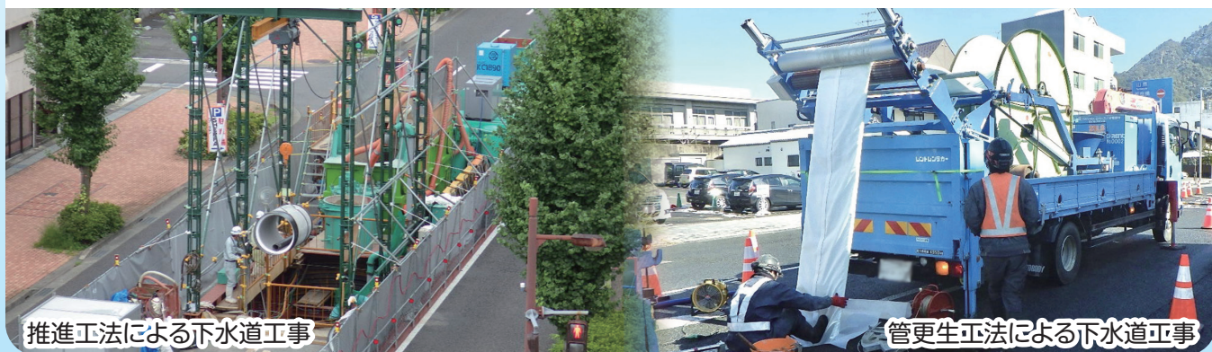
推進工法による下水道工事

下水道工事の方法は、当初は人力による「開削工法」(地面を掘って管を埋める)のみでしたが、現在は地下にトンネル状に穴を掘って管を挿入する「推進工法」や、既設管の内面に樹脂等で新しく管を形成して下水道管の更生を行う「管更生工法」など、なるべく地面を掘らないで効率的に工事を行う「非開削工法」を多く取り入れています。