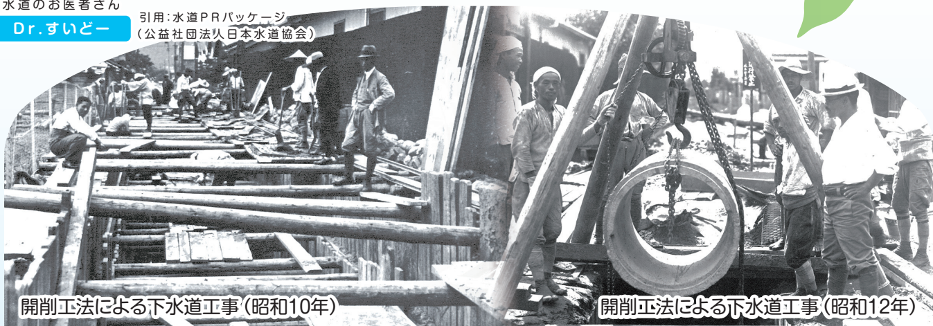
開削工法による下水道工事(昭和10年)